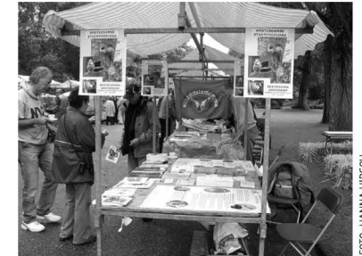
De stand op de Stadsvogeldag in het Beatrixpark