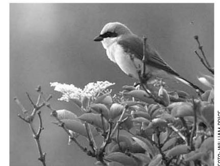
Grauwe Klauwier, Brettenzone, 7 juni 2008

Sijs 10-5 A'dam-Noord 2 ex. (FvG). 11-6 Weesp-C 1 ex. ZW (MV).