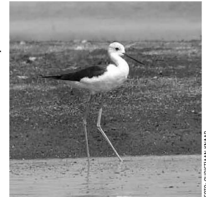
Steltkluut, Waverhoek, 26 april 2008