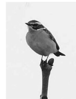
Paapje, Kinselbaai, 28 april 2008

Tapuit 9-4 Aandammergouw 1 ex. (FV). 11-4 t/m 13-4 IJburg 1 ex. (EdB, RR, SW, FO, JvdB). 11-4 t/m 11-5 Landje van Geijsel max. 3 v. (velen). 13-4 Varkensland 1 ex. (FvG). 13-4 t/m 22-5 Waverhoek max. 4 v. (velen). 22-4 t/m 5-5 Middelpolder 1 ex. (AdB, PB, KJ). 23-4 Vijfhoek 1 ex. (JvdB). 23-4 t/m 14-5 Schiphol max. 3 ex. (RR, PT, KJ). 24-4, 10-5 Houtrakkerbeemden-Oost 1 ex. (JvdB, PT). 25-4 t/m 10-5 Schinkelbos max. 2 m. (velen). 26-4 t/m 1-6 Houtrakpolder max. 4 v. en 3 m. (ANH, GvD, RA, CK). 27-4 Marken 1 m. (WvdW). 27-4 Kinselmeer 1 ex. (GP). 27-4 t/m 9-6 Lutkemeerpolder max. 2 ex. (JvB, JvdB). 3-5 Durgerdam 2 ex. (MW). 4-5 Bloemerdalergouw 2 ex. (EH). 5-5 Ouderkerkerplas 1 m. (KJ, JvdB). 7-5, 12-5 Polder de Rondehoep resp. 3 v. en 6 ex. (RR, KJ). 10-5 Amerikahaven 1 ex. (TvD). 10-5 Legmeer 1 ex. (EdV). 10-5, 19-5 Diemerpark resp. 10 en 3 ex. (RA, KJ). 19-5 Osdorper Bovenpolder 1 v. (RR).