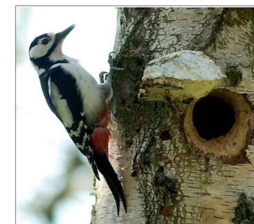
fleuropark, 15 april 2010

Voor de Grote Bonte Specht is het moeilijk alternatieve nestgelegenheid aan te bieden