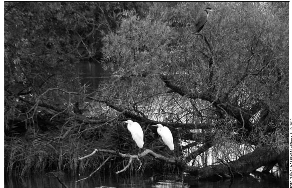
vijfhoek, 8-10-2012