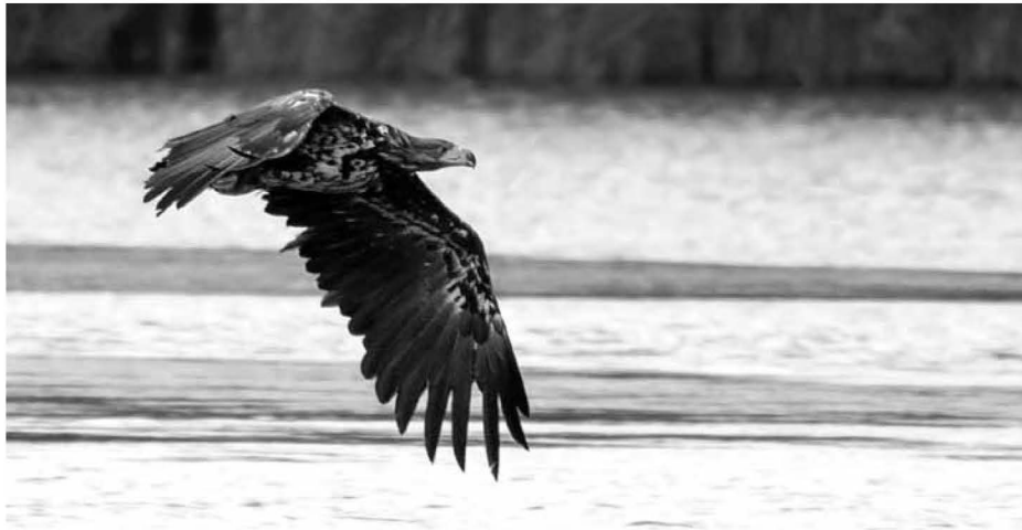
Lepelaarplassen