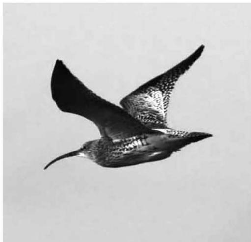
waterland, 14-10-2012

De telgegevens kun je kwijt op sovon.nl . Als je nog geen Sovon-account hebt, maak er één aan (vraag dan ook die handleiding even aan). Onder Slaappleatsen > Vacante gebieden kun je voor Amsterdam e.o. zien waar al geteld wordt en waar nog niet. Daarnaast zijn er in de regio uiteraard slaappleatsen die bij Sovon niet bekend zijn. Voer je telgegevens bij Sovon in onder Mijn slaappleatsen. Op deze wijze kunnen je telgegevens zowel voor het landelijke onderzoek gebruikt worden als voor het overzicht dat wij als VWGA daar uit kunnen halen, niet alleen qua aantallen, maar ook om te zien wie wat telt. Ook voor jezelf geeft Mijn slaappleatsen een goed overzicht als je vaker telt op een slaappleat. Dat laatste hopen we als VWGA natuurlijk van harte, en ook zien we graag dat als je een keer niet kunt tellen, je dan zelf voor een vervanger zorgt.