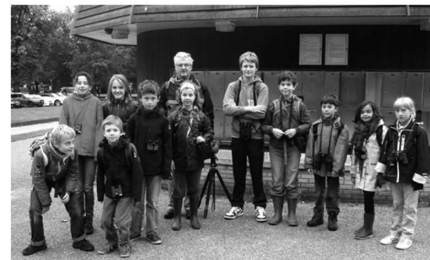
Deelnemers aan de eerste jeugdexcursie in het Amsterdamse Bos