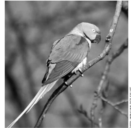
Grote Alexanderparkiet, Kalfjeslaan, 25 november 2013

In dit artikel wordt de ontwikkeling van het aantal ingevoerde waarnemingen geschetst, een overzicht gegeven van de waarnemingen uit 2013 en wordt de periode 2007-2013 uitgelicht.