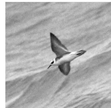
Het stormvogeltje bleek een Rosse Franjepoot!

Op 15 december 2013 om 8 uur verzamelden plusminus 18 mensen op het IJsbaanpad, want er waren werkzaamheden bij het Stadionplein. Terwijl de zon opkwam, reden we naar IJmuiden. Het plan was om via de Kunstenaarsduinen, het Kennemermeer, de Slufter en het strand de Zuidpier op te lopen. Op de weg terug zouden we ook nog de jachthaven bezoeken.