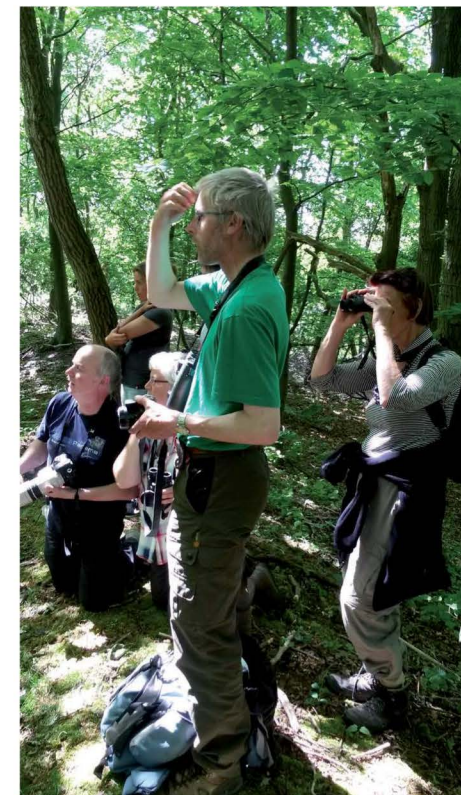
Fotobijlschrift: Fluitert zorgt voor opwindung

De excursies werden zoals gebruikelijk begeleid door doorgewinterde vogelwerkgroepleden. Vanwege het wederom grote aantal deelnemers waren bij elke les drie of zelfs vier docenten aanwezig. Excursiedoelen waren dit jaar Amstelpark en Middelpolder (22 maart), Amsterdamse Bos en Schinkelbos (22 april), Diemerpark en Vijfhoek (27 april), Duin en Kruidberg (18 mei) en tot slot