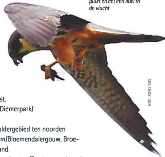
Boomvalk in de Bretten plukt en eet een libel in de vlucht

4 territoria: Westelijk Havengebied AEB en Hemwegcentrale, Zuiden en Uburg