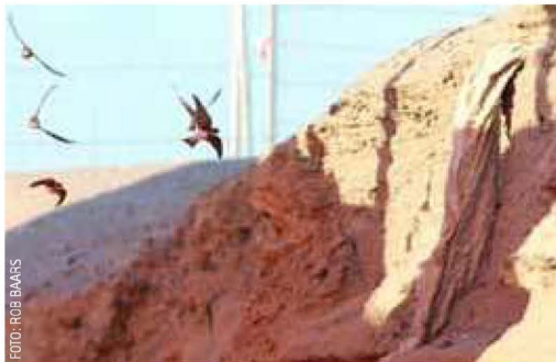
Zandhoop achter Blijburg gekoloniseerd door Oeverzwaluwen, 12 mei 2015

Met dank aan: Stadsdeel Oost, Blijburg, en Els Corporaal