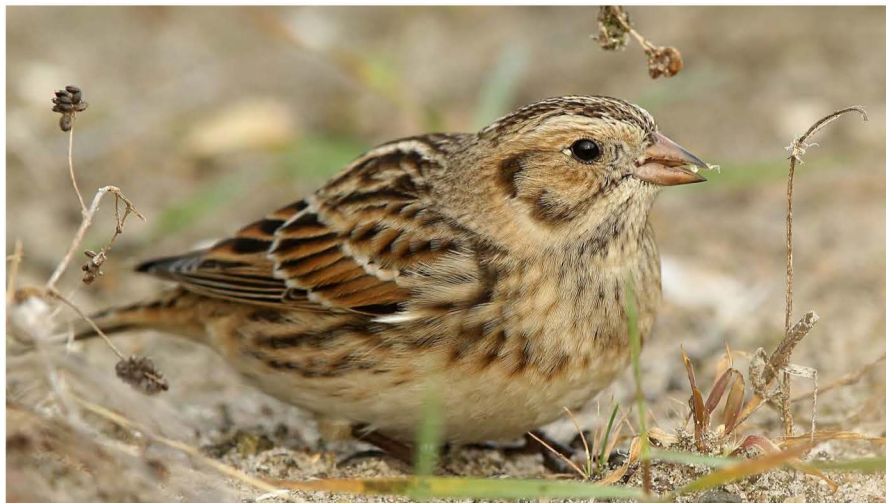
Lsgors, een zeldzame soort voor de regio Amsterdam

De jaarlijkse vogelcursus draagt bij aan de het verspreiden van kennis over en liefde voor wilde vogels in en rond Amsterdam, één van de doelstellingen van de vogelwerkgroep. Door de vogelcursus worden de cursisten gestimuleerd hun hobby verder te ontwikkelen. Tijdens de lessen kunnen de cursisten medevogelaars in een ongedwongen sfeer ontmoeten. Naar aanleiding van de cursus worden elk jaar weer verschillende mensen lid van de vereniging, gaan op eigen houtje het veld in en maken kennis met andere vogelaars. Hopelijk draagt de cursus op termijn ook bij aan de andere doelen van de vogelwerkgroep, te weten onderzoek naar vogels en bescherming van vogels.