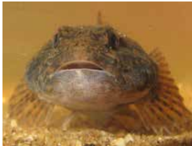
portret rivierdonderpad.

Komend jaar wordt er naast Gelderland ook gemonitord in de Noord-Brabantse natuurgebieden die onderdeel uit maken van het Naturazooon-netwerk. De monitoring richt zich afhankelijk van het gebied op de doelsoorten kamsalamander, grote modderkruiper, bittervoorn, kleine modderkruiper, beekprik en rivierdonderpad.