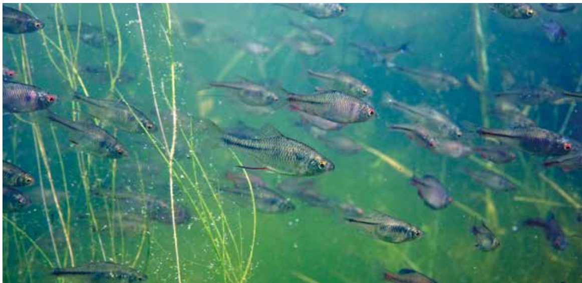
School bittervoorn.