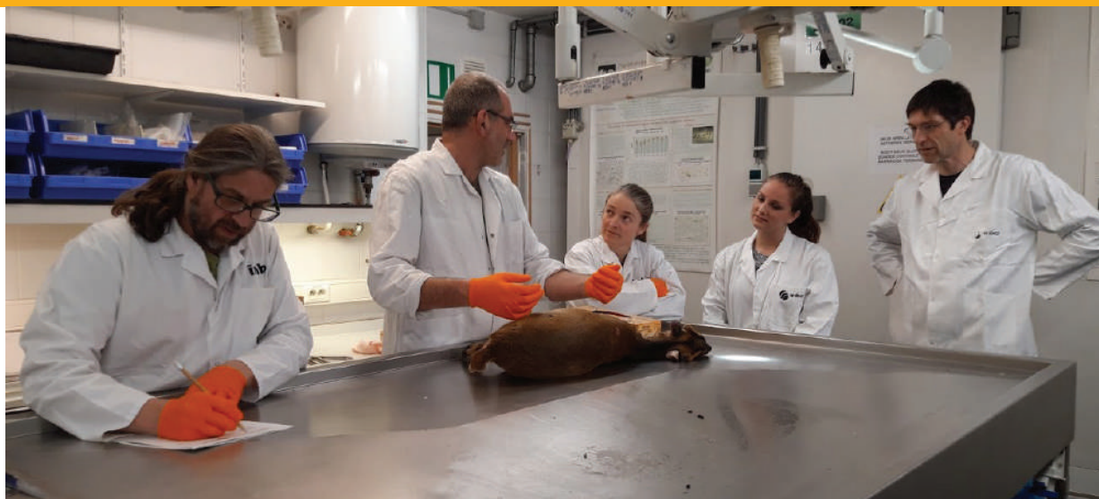
Figuur 3: Autopsie muntjak bij INBO.

In december 2018 werd in Vlaanderen bekend gemaakt dat muntjaks zijn gefokt en vrijgelaten voor de jacht 1) . Er zijn tientallen dieren aangetroffen bij twee mensen die zijn aangehouden. In 2018-2019 werden door de Vlaamse Overheid gerichte inspanningen gedaan om een verdere vestiging van muntjak in Vlaanderen tegen te gaan. Enkele vrijlevende dieren werden met gerichte acties verwijderd uit bosrijke domeinen of natuurgebieden. In het Verenigd Koninkrijk heeft een dergelijke bron geleid tot een explosief gegroeide populatie muntjaks. De British Mammal Society schat dat de dichtheid aan muntjaks al oploopt naar 100 dieren per km 2 in geschikt habitat.