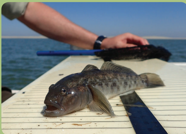
Zwartbekgrondel bij de Marker Wadden.