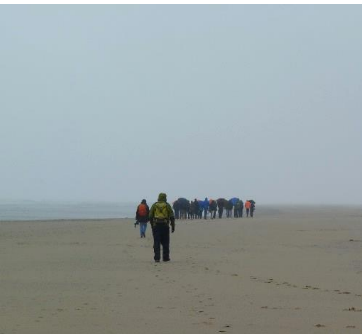
Onderweg naar een in de mist gehuld Noordvoort

Aan de opening van het strandreservaat Noordvoort is in de media veel aandacht besteed. o.a. door: Blik Op Noordwijk, de Weekendkrant van 10 mei en de omgevingsdienst West-Holland.