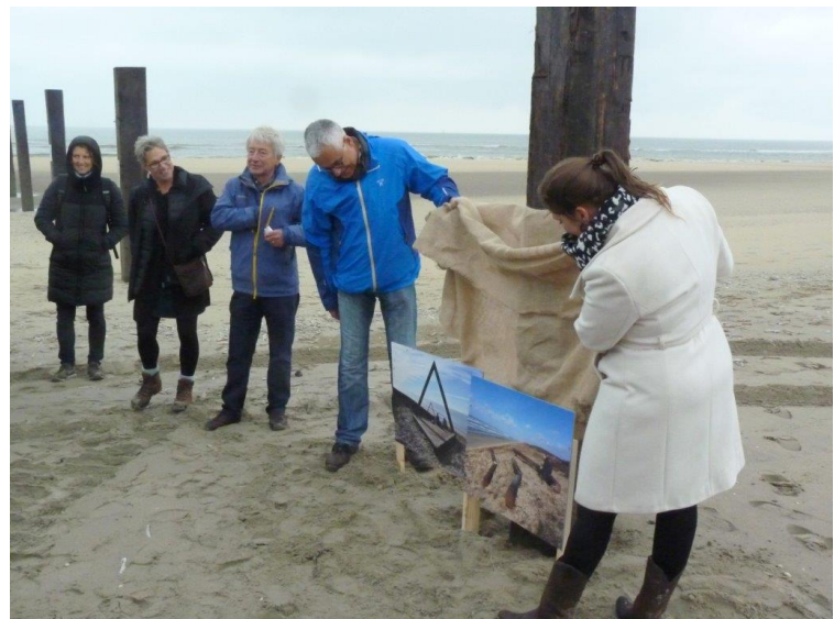
Onthulling fotopanelen Noordvoort