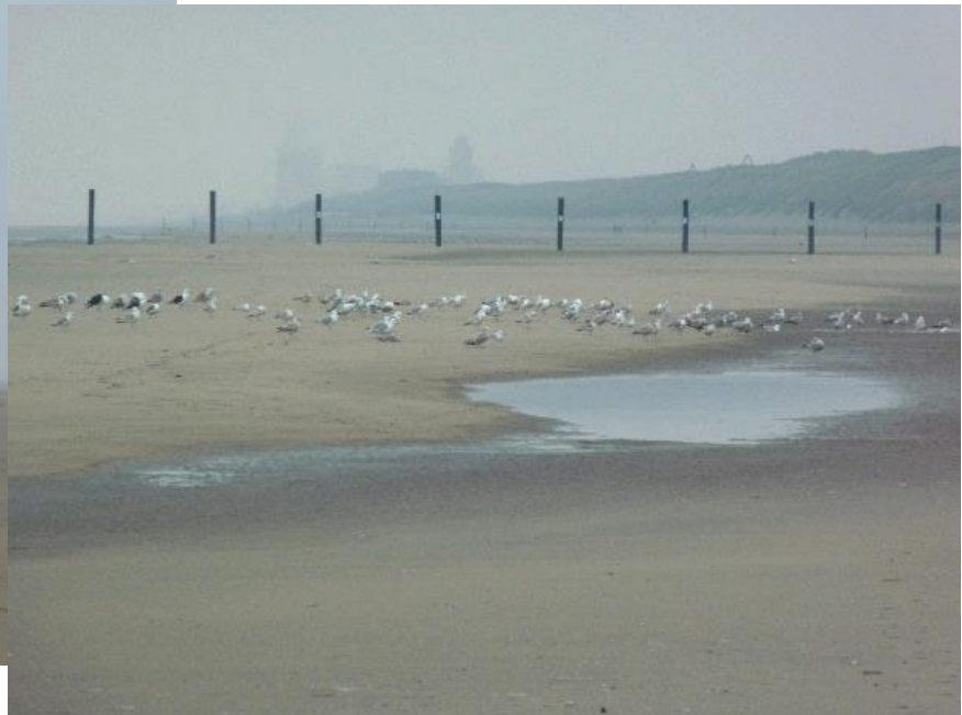
Dit hebben we voor ogen