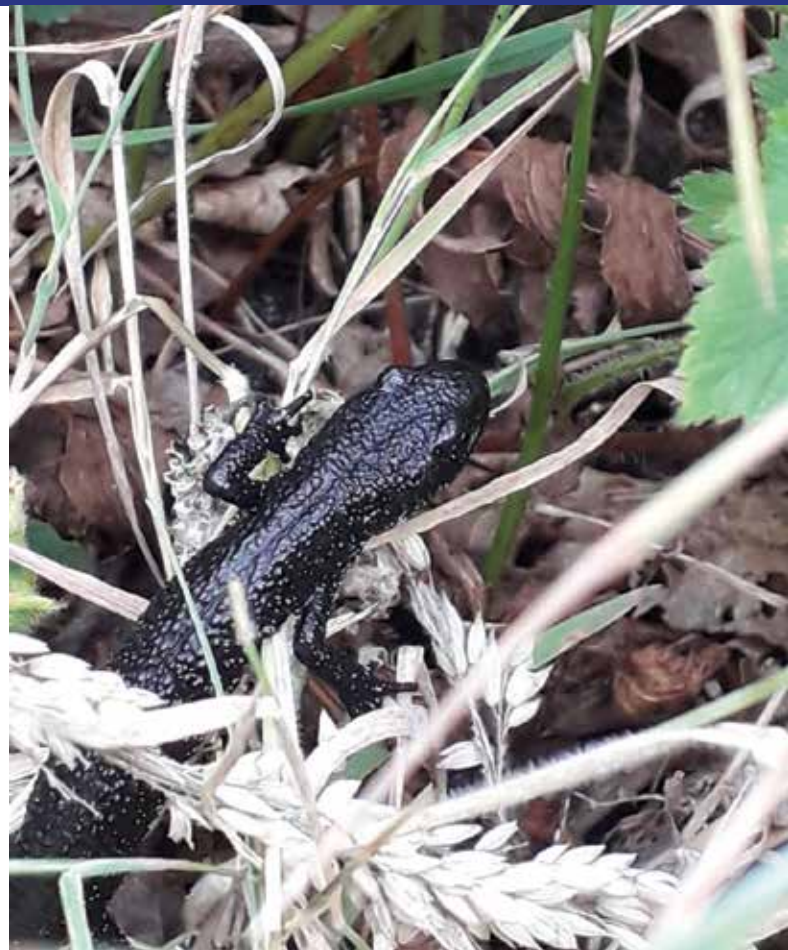
Kamsalamander duikt (weer) op in het zandwallenlandschap van Goeree bij Ouddorp.

Net als andere amfibieën (salamanders en kikkers) gaat de kamsalamander in het voorjaar naar het water voor de paring en de eiafzet. Vanaf half juli gaan ze weer het land op om op de bodem in dichte vegetatie of onder overhangende oevers een verborgen leven te leiden. Ze zijn vooral 's nachts actief.