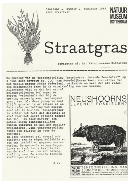
▲ Cover en pagina 1 van Straatgras, jaargang 1, nummer 2.