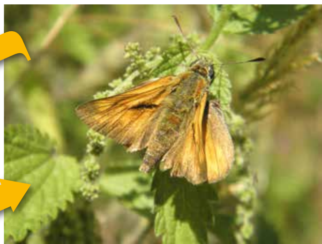
Dikkopje: vis versus dagvlinder.