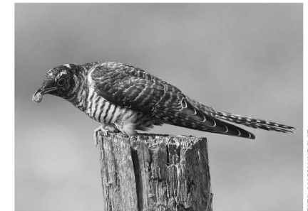
Koekoekjong met nachtvlinderrups