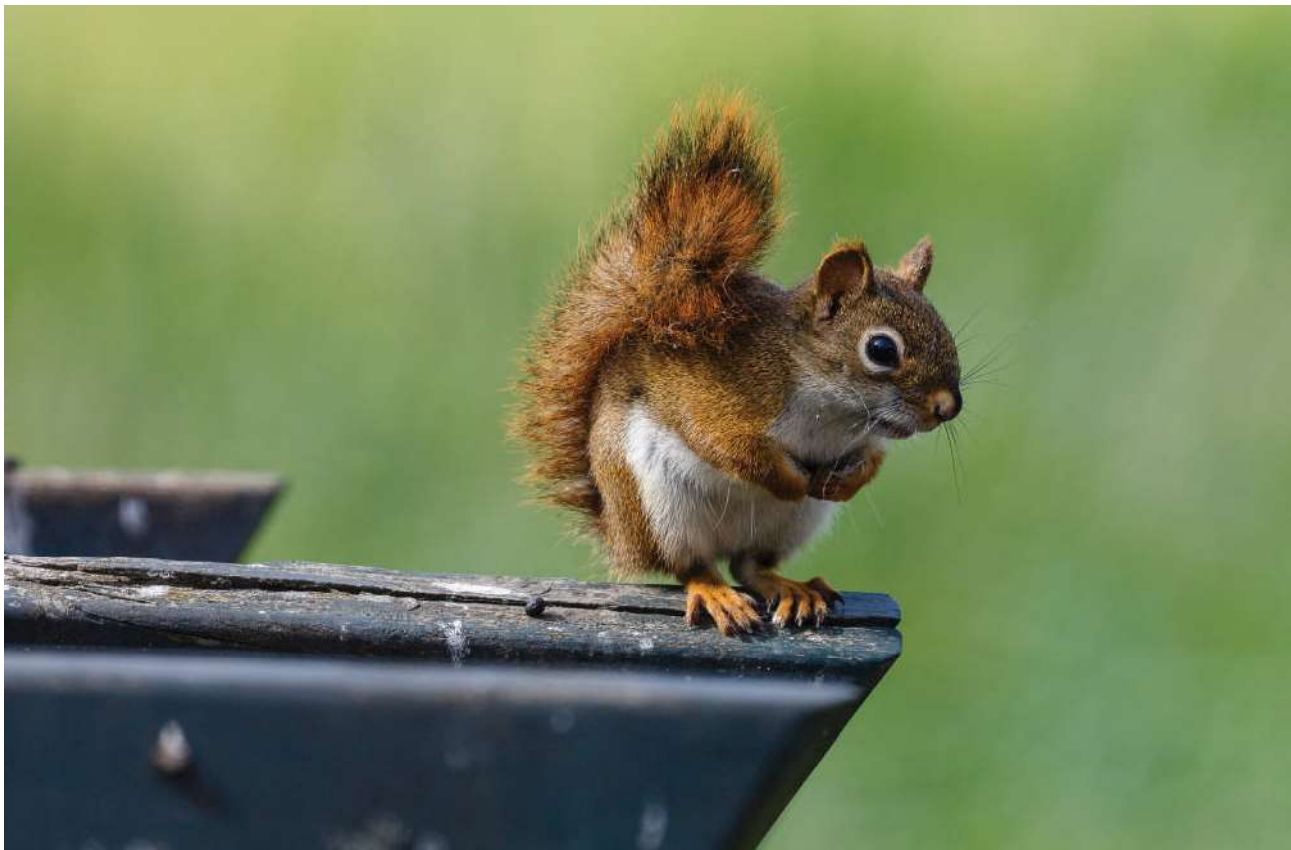
Amerikaanse rode eekhoorn.

De Amerikaanse rode eekhoorn komt van oorsprong voor in grote delen van Canada en delen van Noord-Amerika. De voorkeurshabitat is naaldbos, tweede keus is gemengd bos. Maar hij weet zich ook goed aan te passen aan andere habitats. Hij leeft bij voorkeur alleen en heeft een territorium met name om zijn voedselvoorraad veilig te stellen. Het diertje mag dan klein zijn, maar door zijn felheid doet hij niet onder voor grotere eekhoornsoorten zoals de grijze eekhoorn.