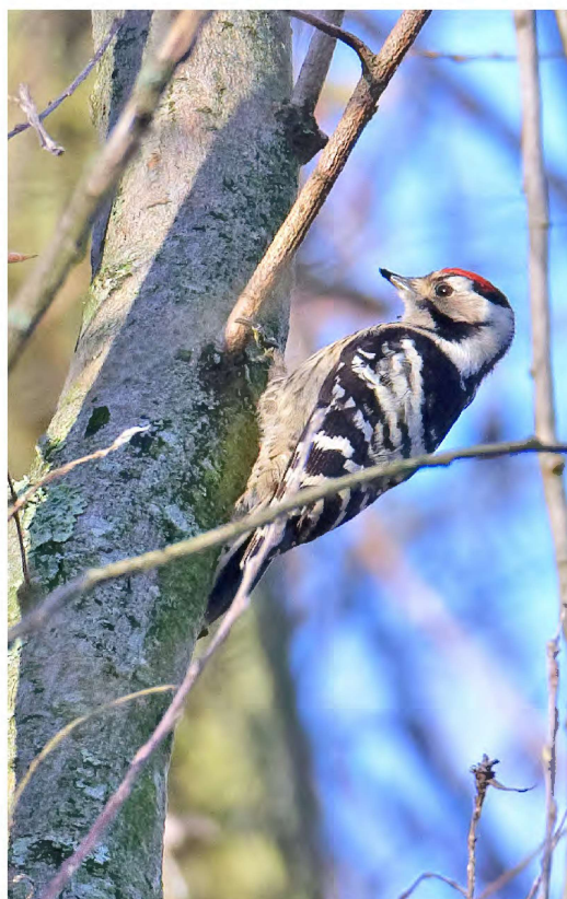
Kleine Bonte Specht op de Diemer Vijfhoek, 14 januari 2019

Patrijs wordt spaarzaam waargenomen, met een maximum aantal van 11 op 19/10 (PM), uiteraard in de omgeving van Schiphol, waar de akkers in een rap tempo worden volgebouwd en omgetoverd tot parkeerplaats; je houdt je hart vast. Het laatste Porseleinhoen van 2018 wordt gefotografeerd op 16/10 in Polder IJdoorn (EdB). Best laat in het jaar voor deze soort, maar het is dan ook nog schitterend weer... Op 18/11 een melding van 4 overvliegende Kraanvogels boven knooppunt