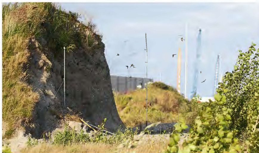
Oeverzwaluwen proberen hun nestgang te bereiken zonder in de mistnetten te belanden

Toen ik aankwam bij de oeverzwaluwheuvel waren er al netten uitgerold. Het is een heel karwei om die netjes neer te zetten, zeker die avond want het waaide nogal, maar met ieders hulp behalve die van mij stonden er op zeker moment toch twee, voor elke wand met hollen eentje. Er hingen meteen twee Oeverzwaluwen in die hun hol uit waren gevlogen. Andersom ging het toch wat minder makkelijk, de Oeverzwaluwen hadden het net goed in de gaten en zochten manieren om hun hol te bereiken zonder verstrikt te raken. Lang hoefden ze er niet te hangen, want na een paar minuten werden de gevangen vogels zorgvuldig en voorzichtig ontward. Het wegen van de vogeltjes (een gram of dertien) ging als volgt: op een digitaal weegschaaltje