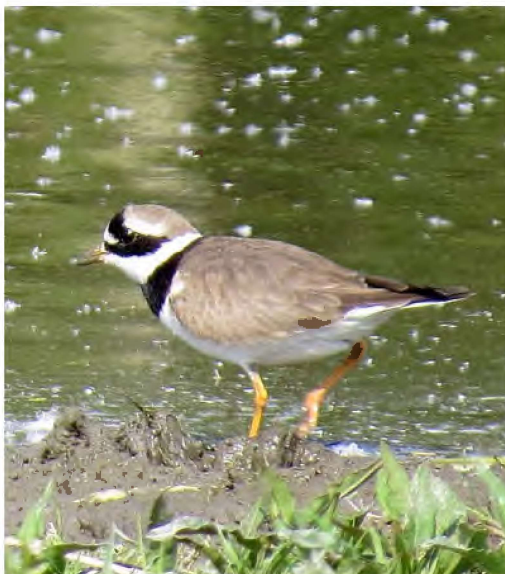
Bontbekplevier, Lutkemeerpolder, 22 mei 2019

Een Grote Jager wordt op 5/5 voor het eerst in de regio gefotografeerd, vliegend over Marken in noordelijke richting (FvG). Een uiterst zeldzame gast, zeker in mei. Frank van Groen heeft over zijn waarneming een stukje geschreven dat is opgenomen in dit nummer van De Gierzwaluw.