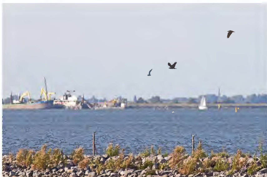
Twee Visarenden op 2 september 2019, boven de baai van de Kruithoorn

De Wespendif wordt op vele plekken waargenomen: 15/7 een vogel bij Schiphol (WvdW). Op 21/7, 23/8 in Botshol 2 vogels (AS, Wouter Kortleve), opvallend na de twee waarnemingen in juni 2019; zou hier een broedgeval mogelijk zijn? 24/7 Watergraafsmeer 2 vogels "overvliegend, cirkelend op thermiek en roepend hoog 'fluitend' pieuw" (Marc Menon), hier ook op 29/8 1 naar zuid (Remco Oosterlaar). 31/8 1 juv. over A'dam-Zuidoost (Tohar Tal). 1 en 16/9 1 in Waterland (WS, ADw). 8/9 een 1kj over Westgaarde in noordwestelijke richting (RR). Vijfhoek en omgeving: 15/8 (WvdS), 21/8 (AS), 24/8 (WvdS); hier vanaf 27/8 bijna dagelijks door de startende trektellingen (max. 5 op 31/8 en 1 en 2/9). Twee pleisterende (jonge) vogels, mogelijk met een adulte vogel, vanaf eind augustus tot in ieder geval 2/9. Op 14/9 in totaal 4 over de Aetsveldsche Polder (EdB, RivD). Op 20/9 op de Vijfhoek de laatste waarneming van het seizoen (GvD).