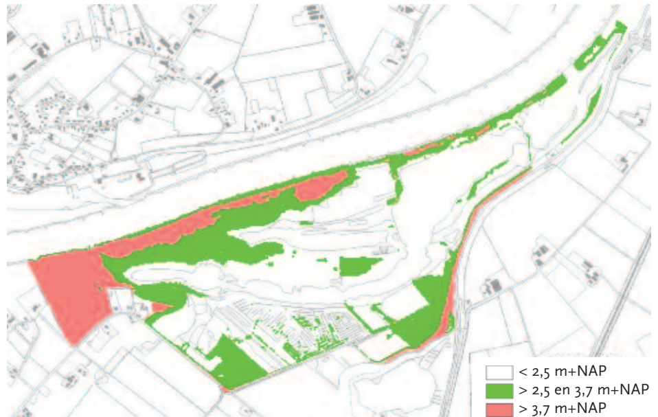
Fig. 3. Hoogteligging maaiveld Duursche Waarden (AHN).

Naast de variatie in hoogteligging en overstromingsduur wordt de vegetatieontwikkeling gestuurd door de integrale begrazing van het gebied, waarbij het graasgedrag beïnvloed wordt door beheerkeuzes. Zo worden de grazers in de Duursche Waar-