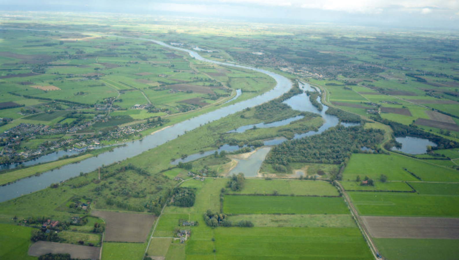
Foto 1. De Duursche waarden in 2007.