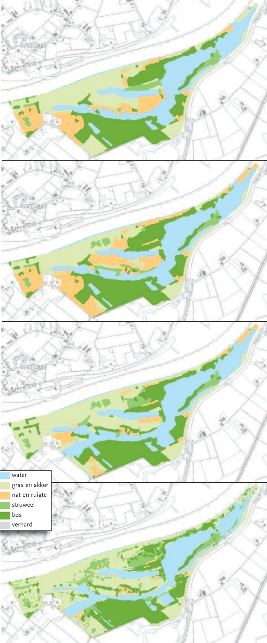
Fig. 4. Ontwikkeling ecotopen in de Duursche Waarden 1998-2005-2008-2011.