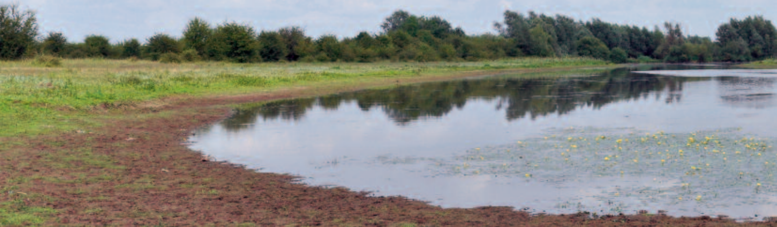
Foto 2. Zicht op de grote geul (2014) na de werkzaamheden voor Stroomlijn.