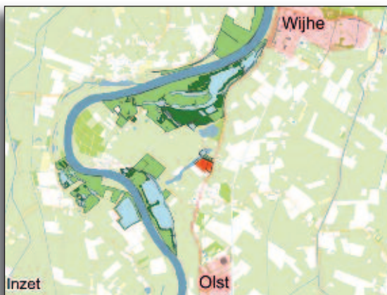
Fig. 1. Overzicht Duursche Waarden in 2014.

De Duursche Waarden maakt deel uit van de kronkelwaard Fortmond tussen Olst en Wijhe. Staatsbosbeheer is sinds 1967 een belangrijke grondeigenaar in het gebied en beheert er inmiddels 193 ha. Ongeveer 133 ha wordt tot het deelgebied Duursche Waarden gerekend (fig. 1). Tot 1976 werd de ontwikkeling van het gebied vooral bepaald door steenfabriek 'Fortmond N.V.' (gevestigd in 1828): door afticheling en extensieve landbouw was er een gevarieerd