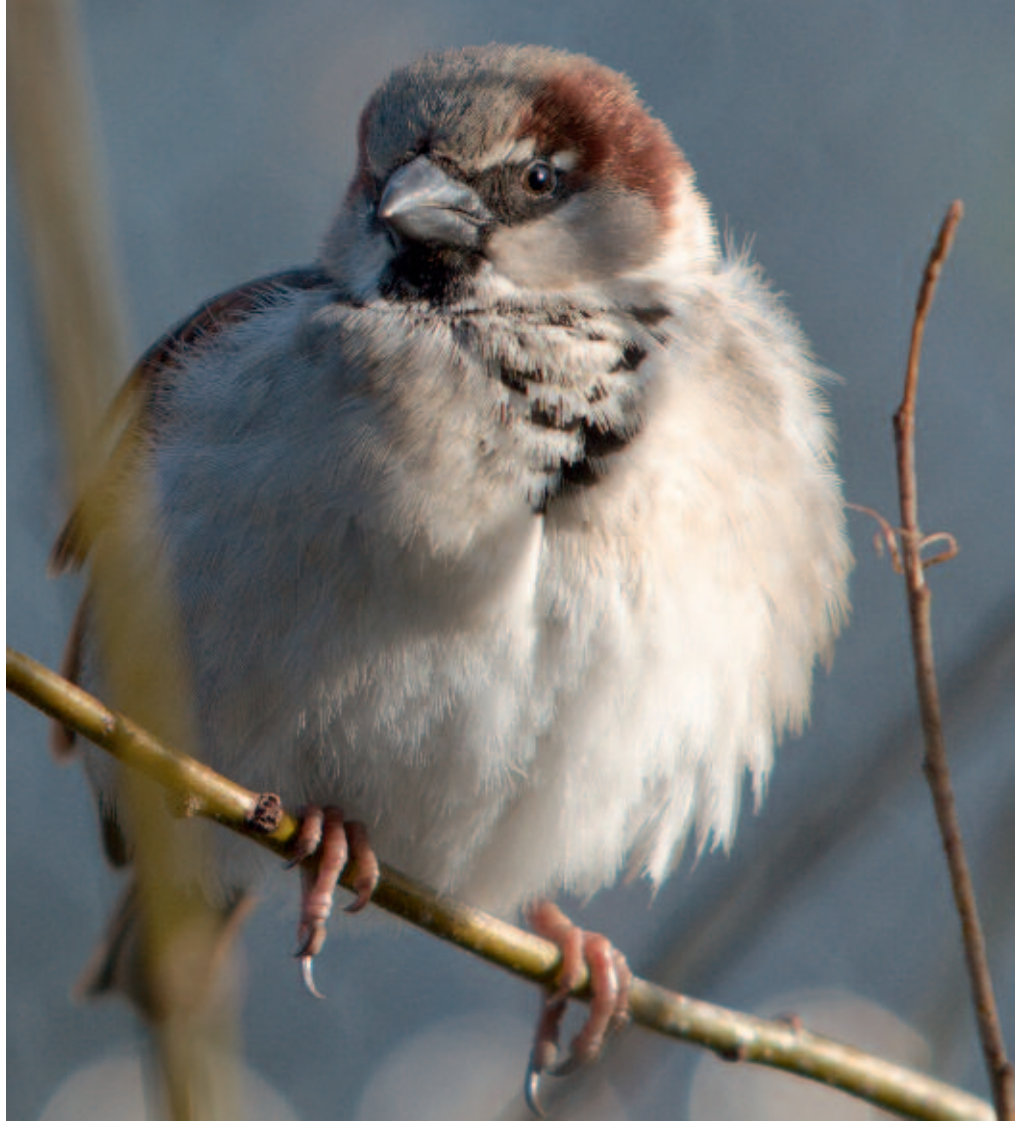
De Huisemus ( Passer domesticus ) is algemeen, maar is zodanig achteruitgegaan dat hij als 'Gevoelig' op de Rode Lijst Vogels is gekomen.

De natuur in Nederland staat al vele decennia onder druk als gevolg van biotoopvernietiging, vermessing en verdroging, en meer recent ook door klimaatverandering. Veel planten- en diersoorten zijn daardoor in populatie-omvang en verspreiding achteruitgegaan. Tegelijkertijd zijn in de afgelopen 20 jaar veel tegenmaatregelen genomen. Niet alleen zijn op grote schaal emissies van milieubelastende stoffen teruggedrongen, maar ook zijn veel gebieden op de schop genomen om natuurwaarden te herstellen (PBL, 2012). Zetten de tegenmaatregelen inmiddels zoden aan de dijk of gaat de achteruitgang onverminderd door?