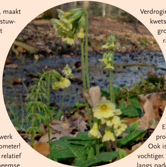
Slanke sleutelbloem

De Lonnekerberg, ten noorden van Enschede, maakt deel uit van de stuwwal van Oldenzaal. Deze stuwwal werd gevormd in de voorlaatste ijstijd, het Saalien. Door de stuwende werking van de ijskap werd klei vermengd met grof zand en werden lemige lagen gevormd. Rond 1900 was de Lonnekerberg een uitgestrekt heidegebied. Op enkele plekken vormden zich bronbeekjes als gevolg van de slecht doorlatende leemlagen in de ondergrond. Rond 1920 werd een groot deel van de Lonnekerberg verworven door textielabrikant Blijdenstein en hierna beplant met uitheemse naaldbomen. Ook werd een uitgebreid rabattennetwerk aangelegd met een lengte van meer dan 300 kilometer! Sindsdien heeft zich op de Lonnekerberg een relatief vochtig gemengd bos ontwikkeld, met de uitheemse naaldbomen als beeldbepalend aspect. Soorten als Lariksspijkerzwam, Gebogen driehoeksvaren, Zevenster en Bospaardenstaart komen hier voor. Op diverse plekken herinneren soorten als Fraai hertshooi, Moerasviooltje en Klein glidkruid aan een meer open vegetatie. Ook Boommarter en Kortsnavelboomkruiper zijn aanwezig en langs de bronbeken staat nog een kleine populatie Slanke sleutelbloem.