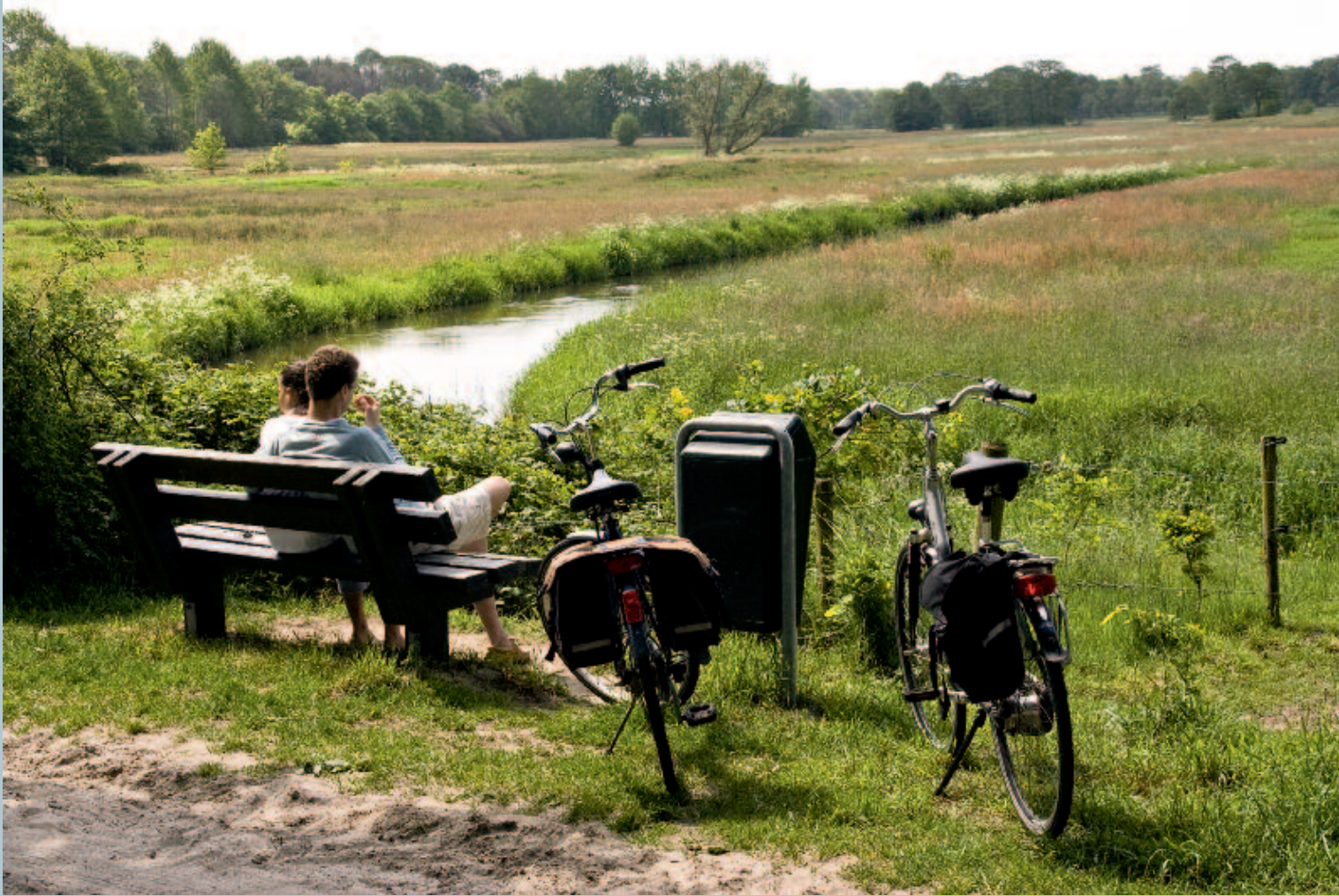
Recreanten kijken uit op het Schipborgsche Diep.