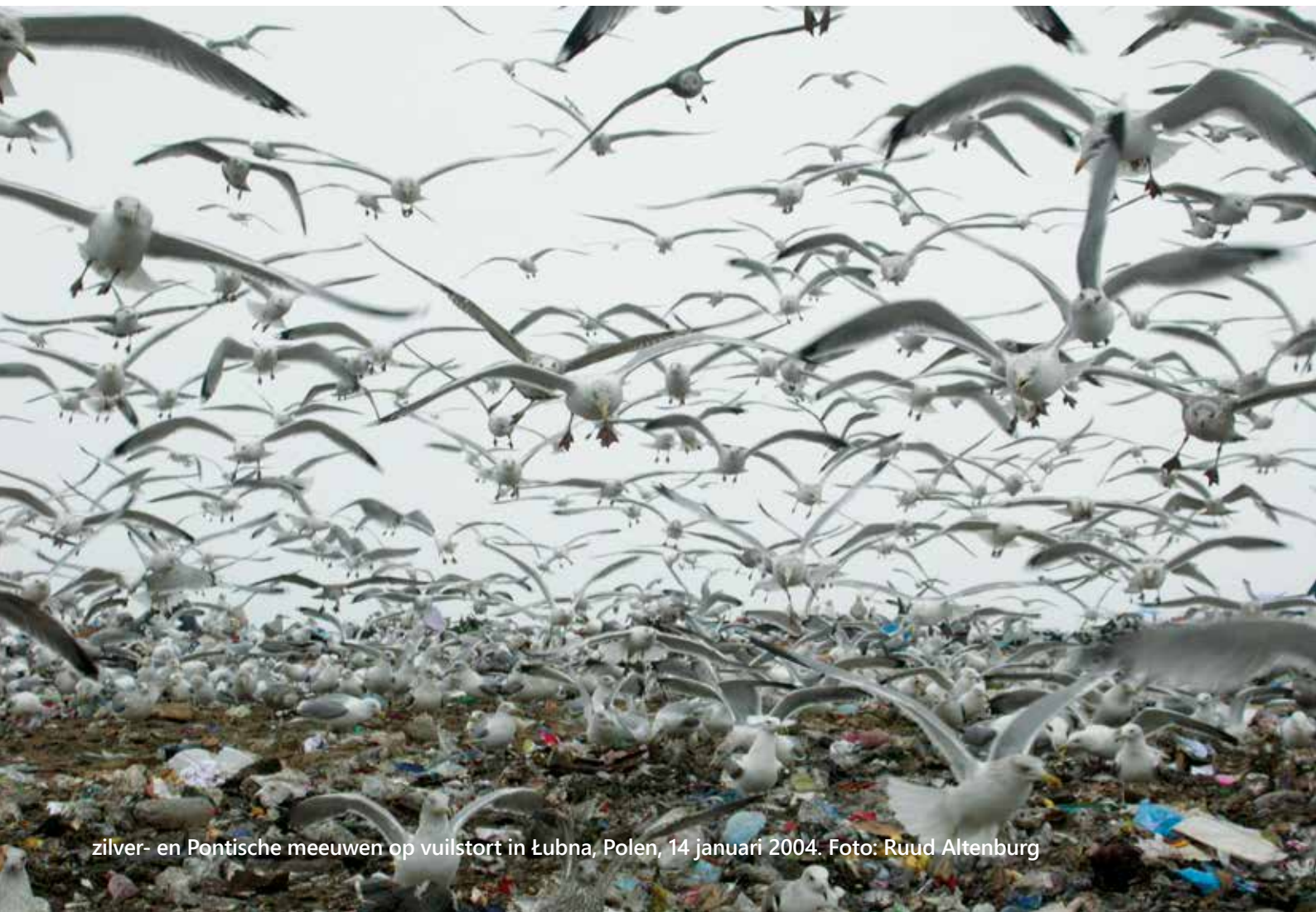
zilver- en Pontische meeuwen op vuilstort in Łubna, Polen, 14 januari 2004.