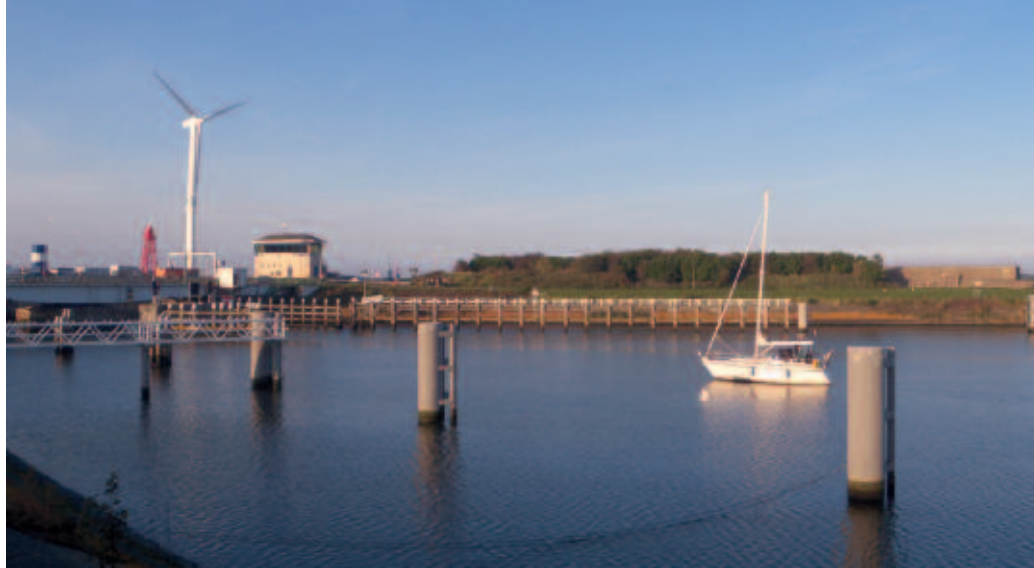
Kleine windturbine langs Afsluitdijk, ter hoogte van Den Oever. Hier en in de omgeving zullen in de toekomst meerdere hoog rendement turbines worden geplaatst.

1. Voorkómen van slachtoffers is het beste. Vleermuizen volgen bij de migratie vaak allerlei lijnvormige elementen, zoals een bosrand, dijktalud, langs kust van meer of zee (vleermuizen migreren zowel over land als over water, soms worden dieren ook tot ver op zee waargenomen (Boshamer & Bekker, 2008)). Diverse onderzoekers (o.a. Rodrigues et al., 2008) adviseren om die