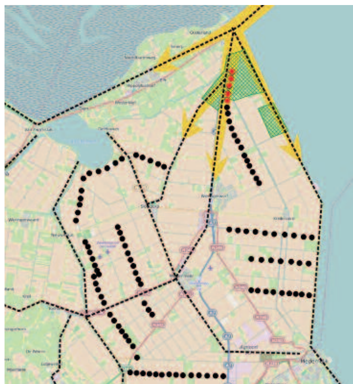
Fig. 2. De casus in de Wieringermeer (provincie Noord-Holland). Hier worden meer dan 100 windturbines geplaatst (zwarte stippen). Vijf turbines (rode stippen) liggen midden in een belangrijk gebied voor migratie en paring van vleermuizen (groene gebied). Dezelfde turbines liggen ook langs belangrijke migratie routes (gele pijlen) van de Meervleermuis en Ruige dwergvleermuis die de Afsluitdijk volgen om vervolgens via diverse waterwegen en kustlijnen (dunne zwarte stippellijn) verder naar het zuiden te vliegen.

Vleermuizen worden op dit moment vooral slachtoffer van windturbines die bij lage windsnelheden draaien, omdat ze juist dan zelf actief zijn. Het is goed mogelijk om deze slachtoffers grotendeels te voorkomen. Ten eerste, geen turbines plaatsen op plekken met hoge aantallen vleermuizen, zoals geschikt jachthabitat en langs migratieroutes. Ten tweede, turbines stilzetten in voor vleermuizen kwetsbare omstandigheden en periodes. Deze tweede stap betreft met name omstandigheden met lage windsnelheden en stilzetten gaat dan nauwelijks ten koste van de totale energieopbrengst van een windturbine. Gezien de aanzienlijke kans die vleermuizen hebben om slachtoffer te worden, zouden dit soort maatregelen bij nieuwe en bestaande turbines verplicht gesteld moeten worden, vooral in gebieden waar