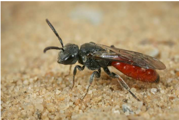
Figuur 1. Een vrouw van de kortsnuitbloedbij Sphecodes majalis .

Als gastheer van de kortsnuitbloedbij wordt Lasioglossum pallens de waaiergroefbij gemeld (Stoekhert 1954, Westrich 1989, Raemakers 2004). Deze groefbij heeft een afwijkende fenologie ten opzicht van de meeste groefbijen. De mannetjes vliegen namelijk al in het voorjaar. Dit in tegenstelling tot de meeste soorten van dit genus, daarvan vliegen de mannen in de zomer. De broedparasiet Sphecodes majalis heeft zich daar blijkbaar bij aangepast, want ook van deze bloedbij vliegen de mannetjes in het voorjaar. Van nagenoeg alle andere bloedbijen vliegen die in de zomer.